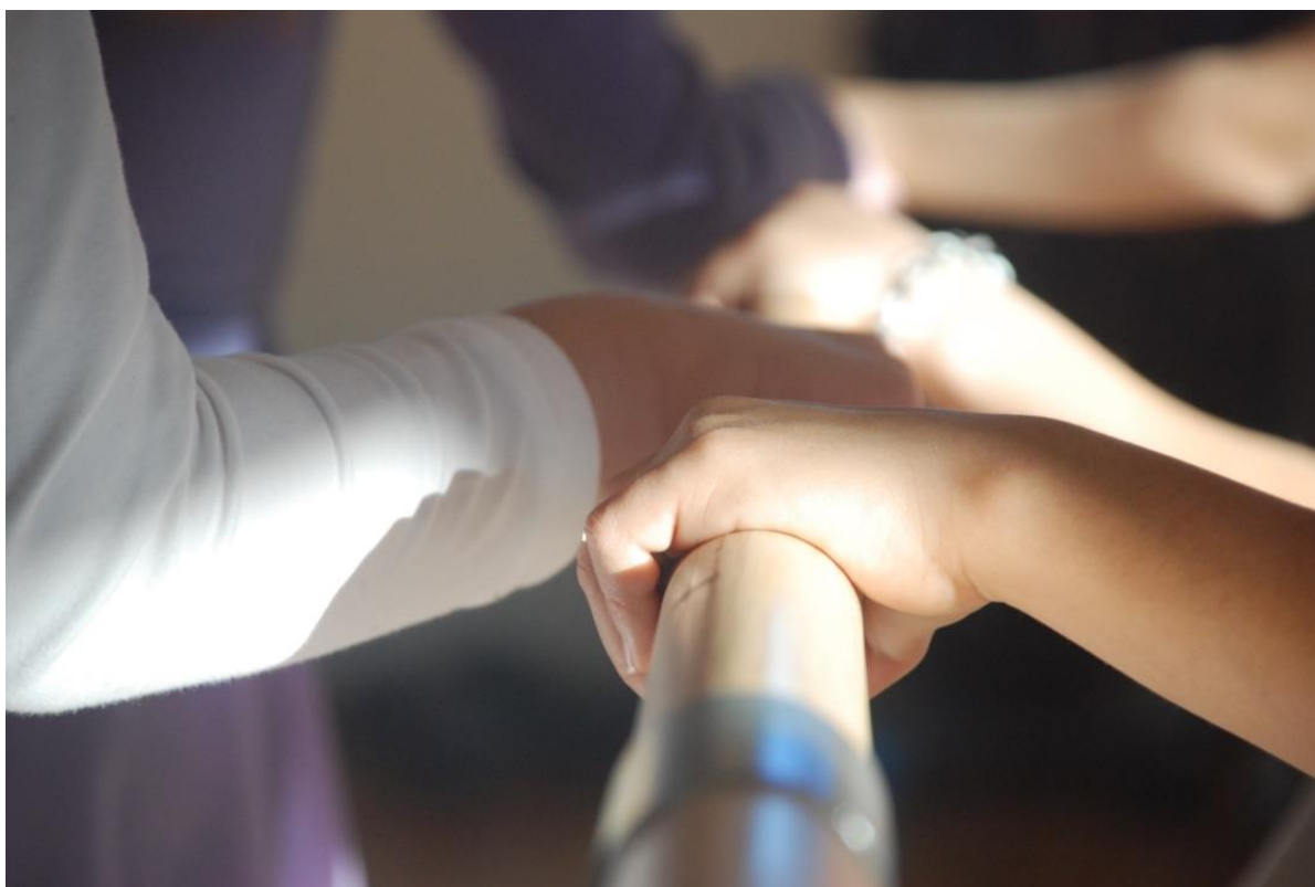
Fra klassisk ballettundervisning i Karmøy Kulturskole, 2014

Viderekommende grupper i dans. Det er fokus på teknikktraining, tøying og styrke av muskulatur, improvisasjon, koreografering, samt mer innøvd avansert koreografi. Elevene er innom ulike dansesjangre, med hovedvekt på jazzteknikk, og moderne / samtidsdans for de eldste elevene. Dans Videre får opptre på ulike arena i løpet av året, i tillegg til den årlige store danseforestillingen. Elevene må gå på minst ett annet dansetilbud i uken.