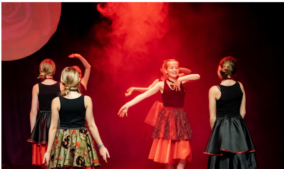
Fra danseforestillingen «Norsk på norsk» i Karmøy Kulturskole, 2022