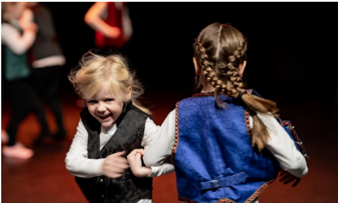
Fra danseforestillingen «Norsk på norsk» i Karmøy Kulturskole, 2022