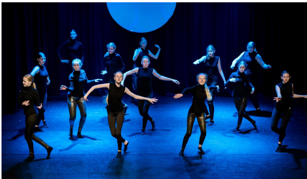
Fra danseforestillingen «Norsk på norsk» i Karmøy Kulturskole, 2022

Dans i kulturskolen er en kulturell og kunstnerisk aktivitet. Karmøy Kulturskole gir opplæring i ulike danseformer, som klassisk ballett, jazzdans, moderne / samtidsdans, hip hop funk og danselek m.m. Viktige handlinger i faget er å utøve, formidle, skape, oppleve og reflektere . Dans kan stimulere til kreativitet, utfoldelse, mestring og bidra til en positiv holdning til egen kropp, dannelse og identitetsutvikling. Aktiviteten skal være lystbetont, sosial og meningsfull for alle som tar del i tilbudet.