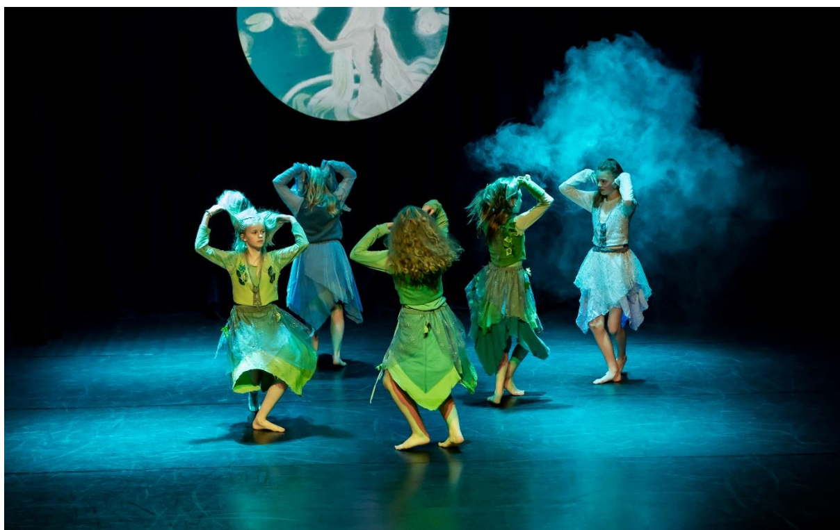
Fra danseforestillingen «Norsk på norsk» i Karmøy Kulturskole, 2022