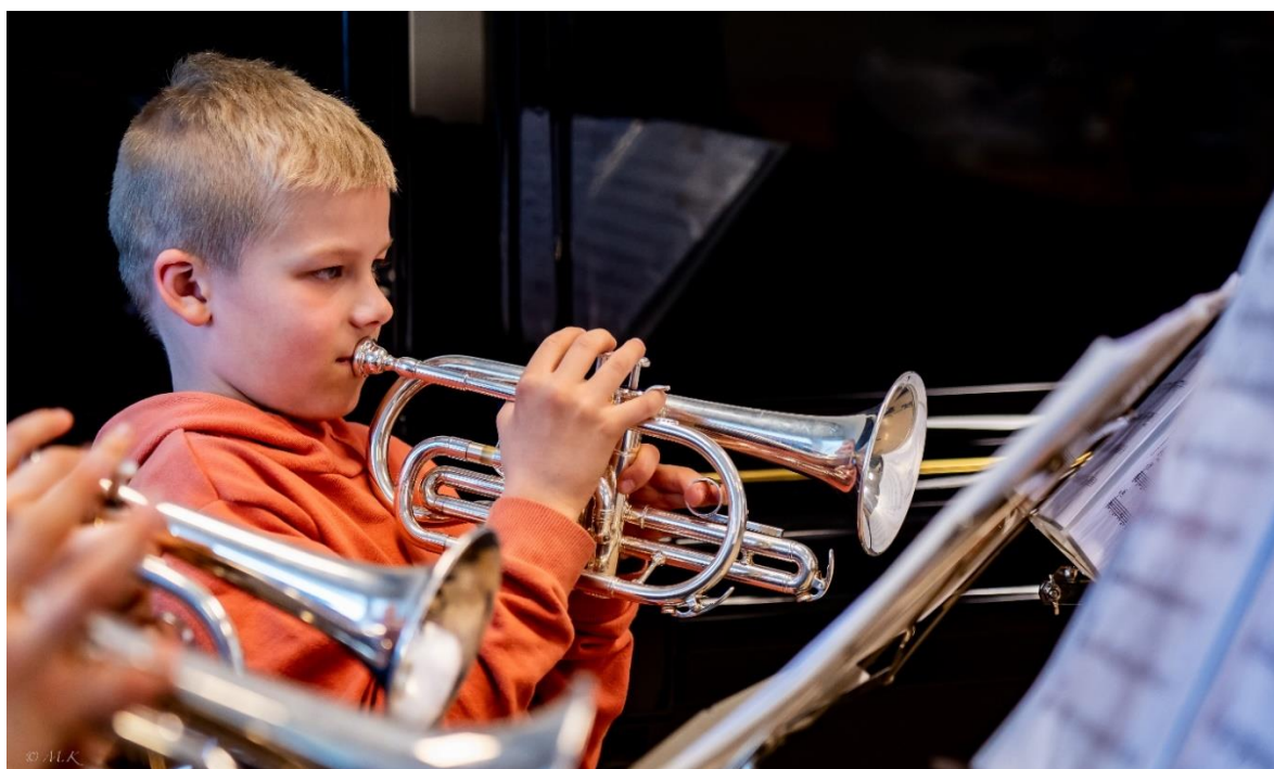
Fra presentasjon av messing på SPILLOPP, Åpen dag på Karmøy Kulturskole, 2022

Karmøy Kulturskole tilbyr undervisning i messinginstrumentene kornett, trompet, althorn, eufonium, tuba og trombone. Elever kan starte på undervisning i et messinginstrument fra 2. klasse, og det vil også være muligheter for samspill med andre elever på messing. Messinginstrumentene brukes blant annet i klassisk, jazz, pop og flere andre stilarter. Dette gir gode muligheter for individuell utvikling innenfor mange ulike sjangre.