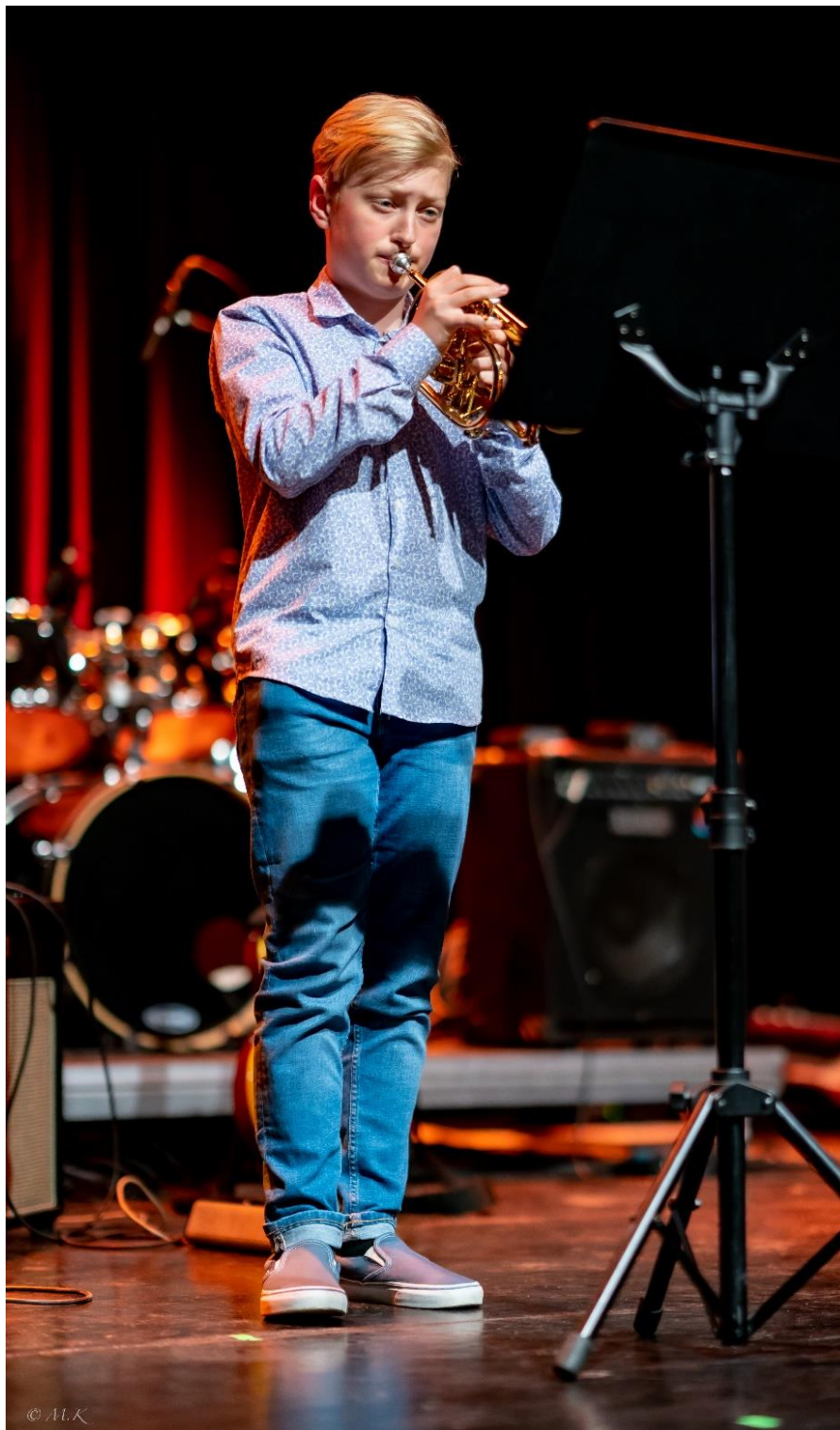
Spillerom-konsert på Karmøy Kulturskole, våren 2022

Det er en forutsetning at eleven har sitt eget instrument. Kulturskolen har instrumenter til utleie.