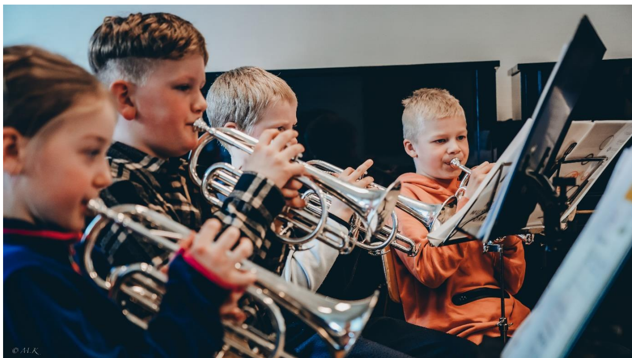
Fra presentasjon av messing på SPILLOPP, Åpen dag på Karmøy Kulturskole, 2022