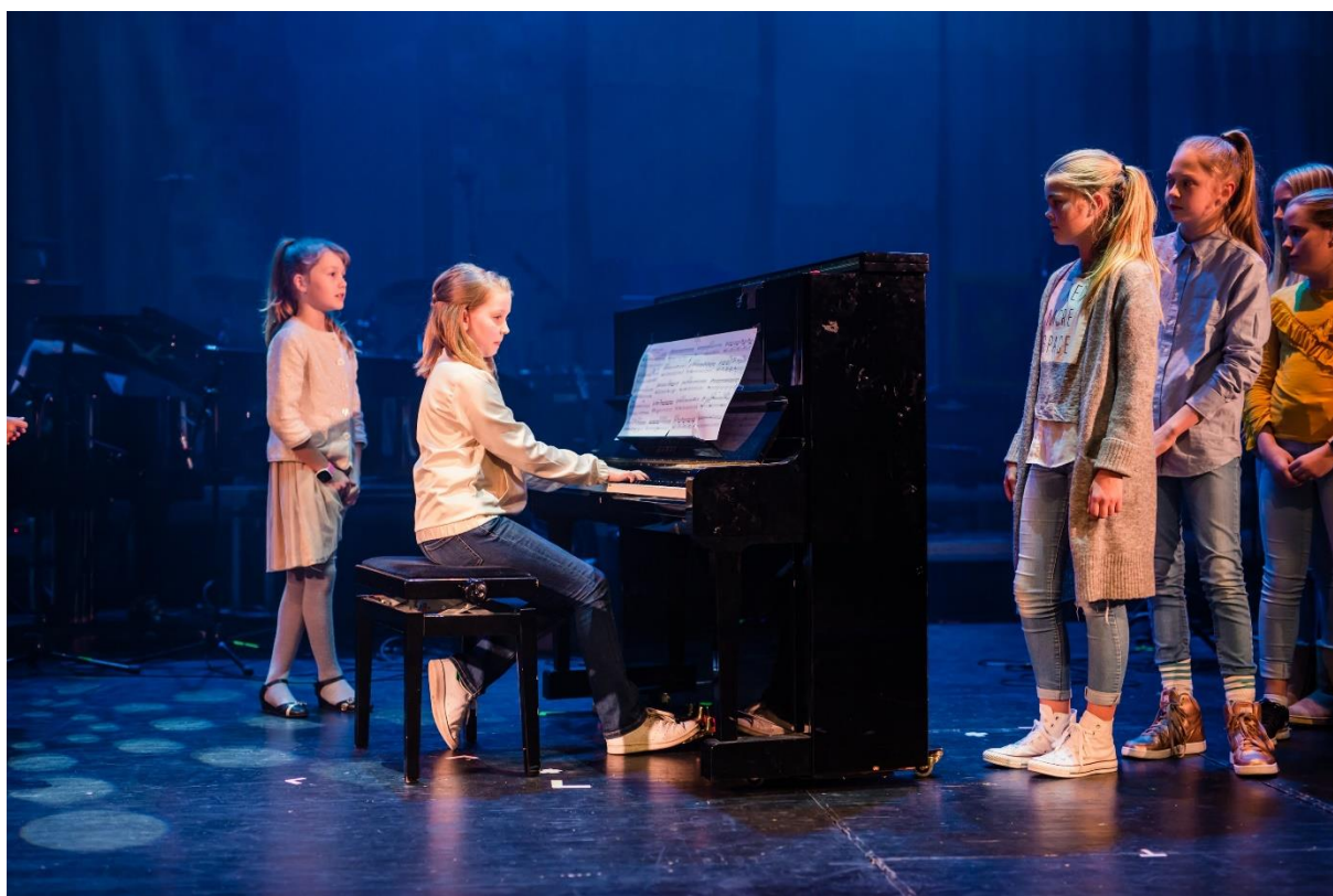
Fra jubileumsforestillingen «Lykken er» i Karmøy Kulturskole, 2018

Piano er et allsidig og populært instrument som brukes innenfor mange sjangre. I Karmøy Kulturskole kan elever starte på piano fra 2. klasse. Undervisningen er organisert som en-til-en undervisning, og det er også muligheter for samspill (4-hendig, 2 pianoer). I løpet av skoleåret vil det i tillegg være anledning til samspill med elever på andre instrumenter, gjennom ulike prosjekter og konserter. Øving er sentralt for at eleven skal oppleve mestring og utvikling på instrumentet over tid, og øving hjemme er derfor en viktig forutsetning for fremgang på instrumentet.