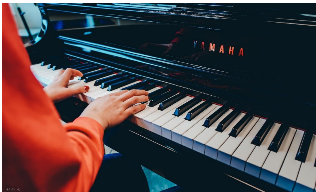
Fra presentasjon av piano på SPILLOPP, Åpen dag på Karmøy Kulturskole, 2022