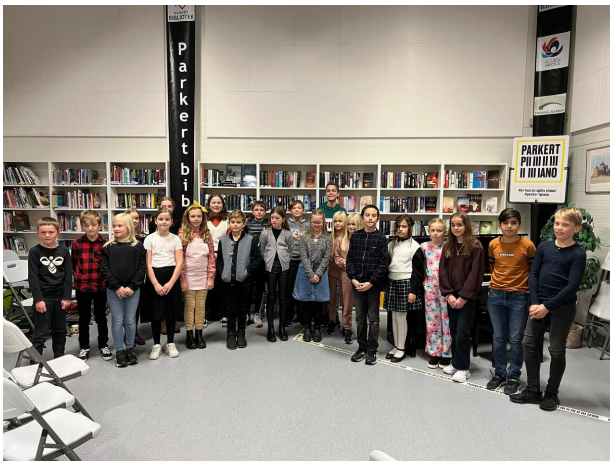
Parkert Piano konsert med pianoelever fra Karmøy Kulturskole på Storhall Karmøy, Vedavågen (2021)