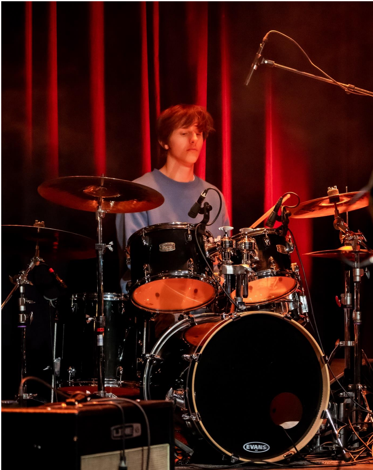
Spillerom-konsert på Karmøy Kulturskole, våren 2022