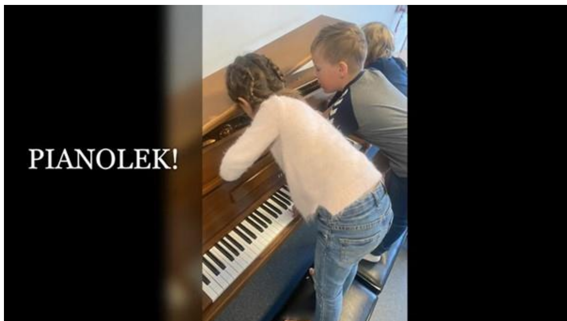
Utforsking av pianoet i faget pianolek

På pianolek i kulturskolen får elevene opplæring i musikkens grunnelementer, notasjon og begreper. Gjennom lekende aktiviteter rundt piano og melodiske rytmeinstrumenter vil elevene variere mellom å spille, tegne og bevege seg. Pianolek er for elever i 1. klasse, og undervisningen gjennomføres i grupper. Denne lekende fasen av begynneropplæringen handler om å gi elevene forståelser om musikkens grunnelementer (melodi, tonehøyde, harmoni, rytme, tekstur og form) og dens overgang til den skriftlige verden, til musikkens notasjon. Notasjon, kroppslig rytme, rytmeinstrumenter, melodiske instrumenter, samspill og øving er sentrale elementer i faget.