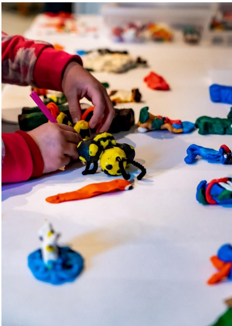
Fra presentasjon av kulturlek på SPILLOPP, Åpen dag på Karmøy Kulturskole, 2022