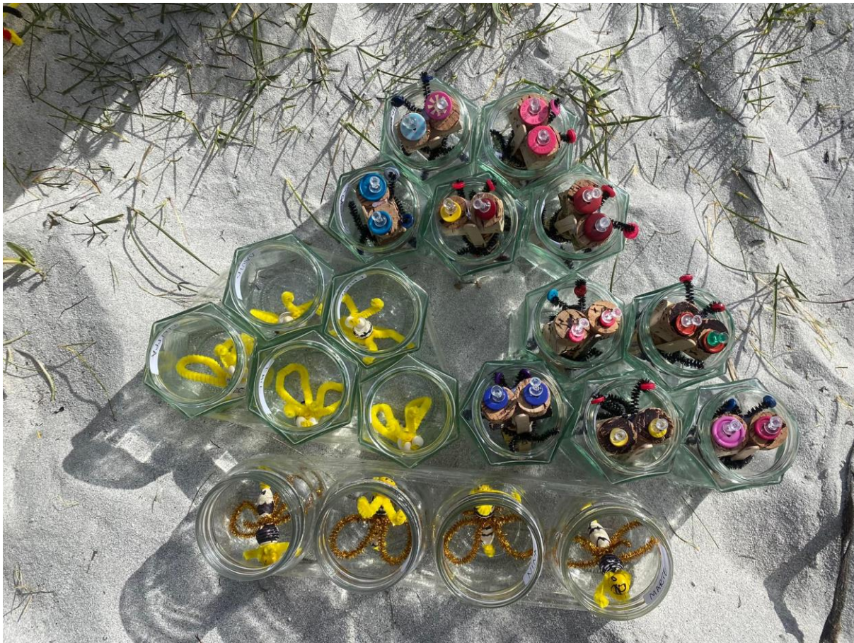
Bieby-utstilling laget av elever på kulturlek (Strandlek, Åkrasanden, 2022)