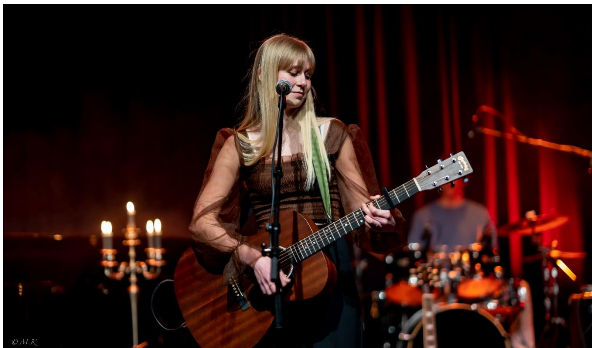
Spillerom-konsert på Karmøy Kulturskole, 2022