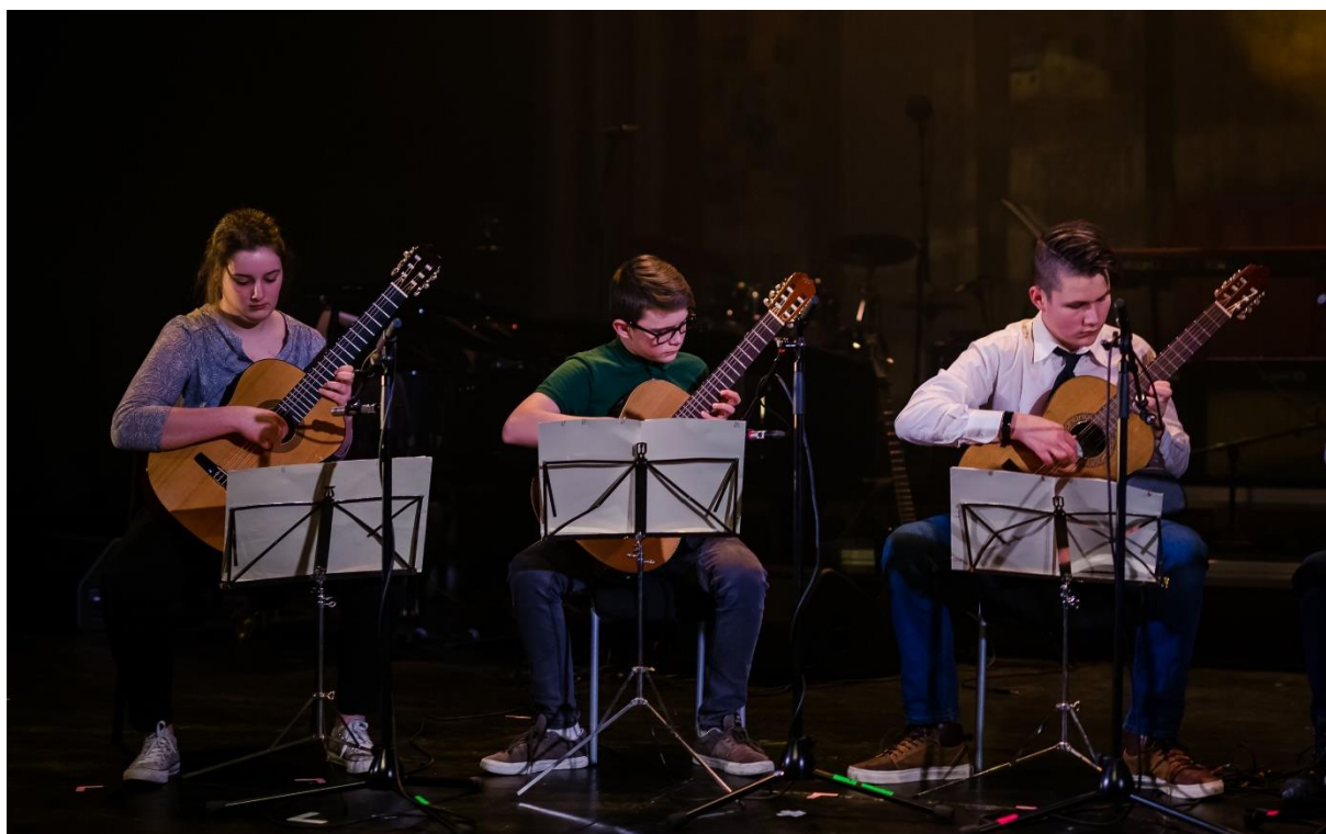
Fra jubileumsforestillingen «Lykken er» i Karmøy Kulturskole, 2018

Gjennom gitaropplæring i kulturskolen legges det et grunnlag for elevene til å forholde seg til ulike typer musikk. Denne kjennskapen gir flere måter å bruke gitaren på, der elevene kan reflektere og la seg inspirere til å bruke ulike uttrykk og sjangre. Gode grunnteknikk i klassisk og rytmisk gitar gjør også at stilarter som pop / rock / folk / jazz og improvisasjonsteknikker blir enklere å mestre.