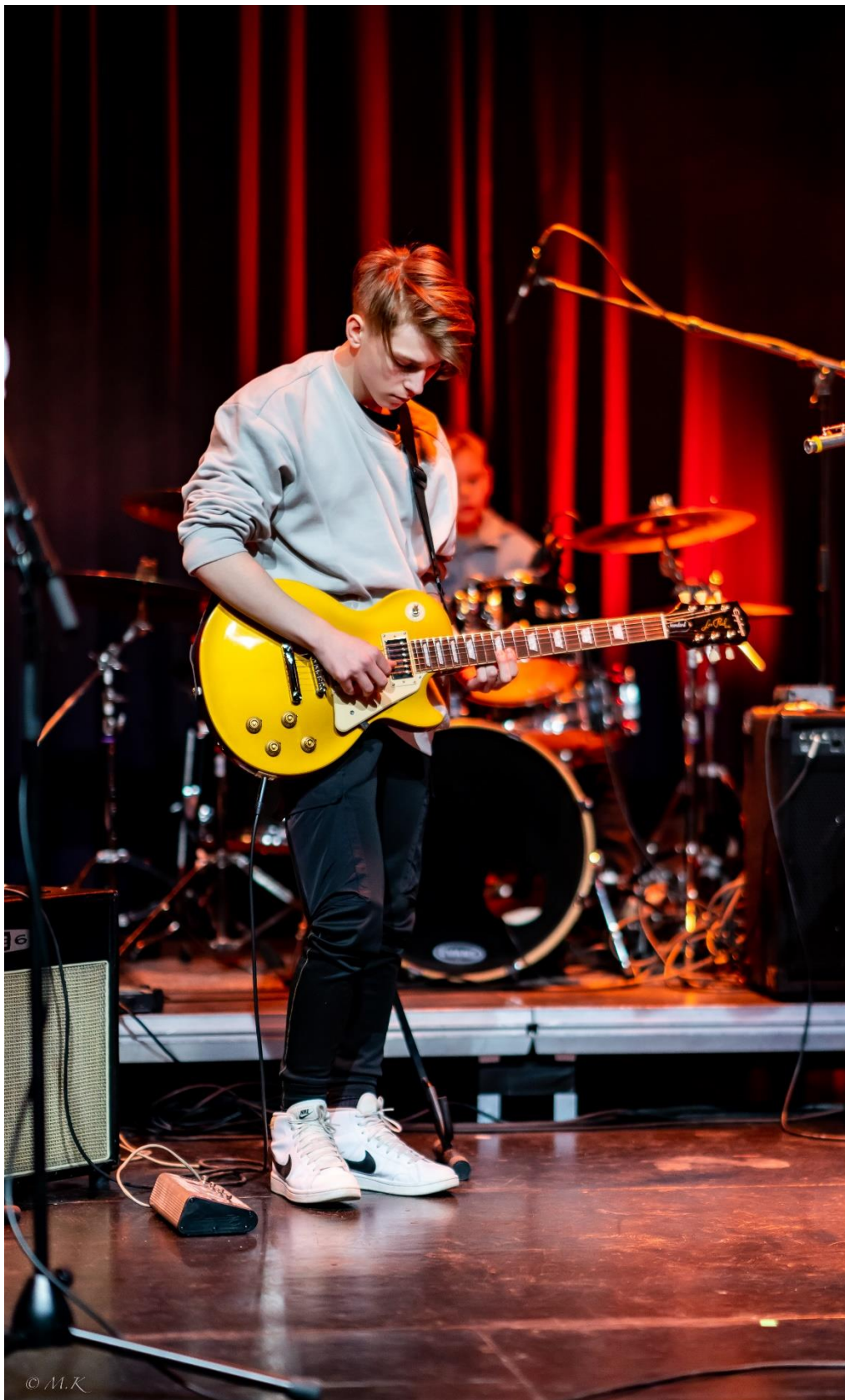
Spillerom-konsert på Karmøy Kulturskole, 2022