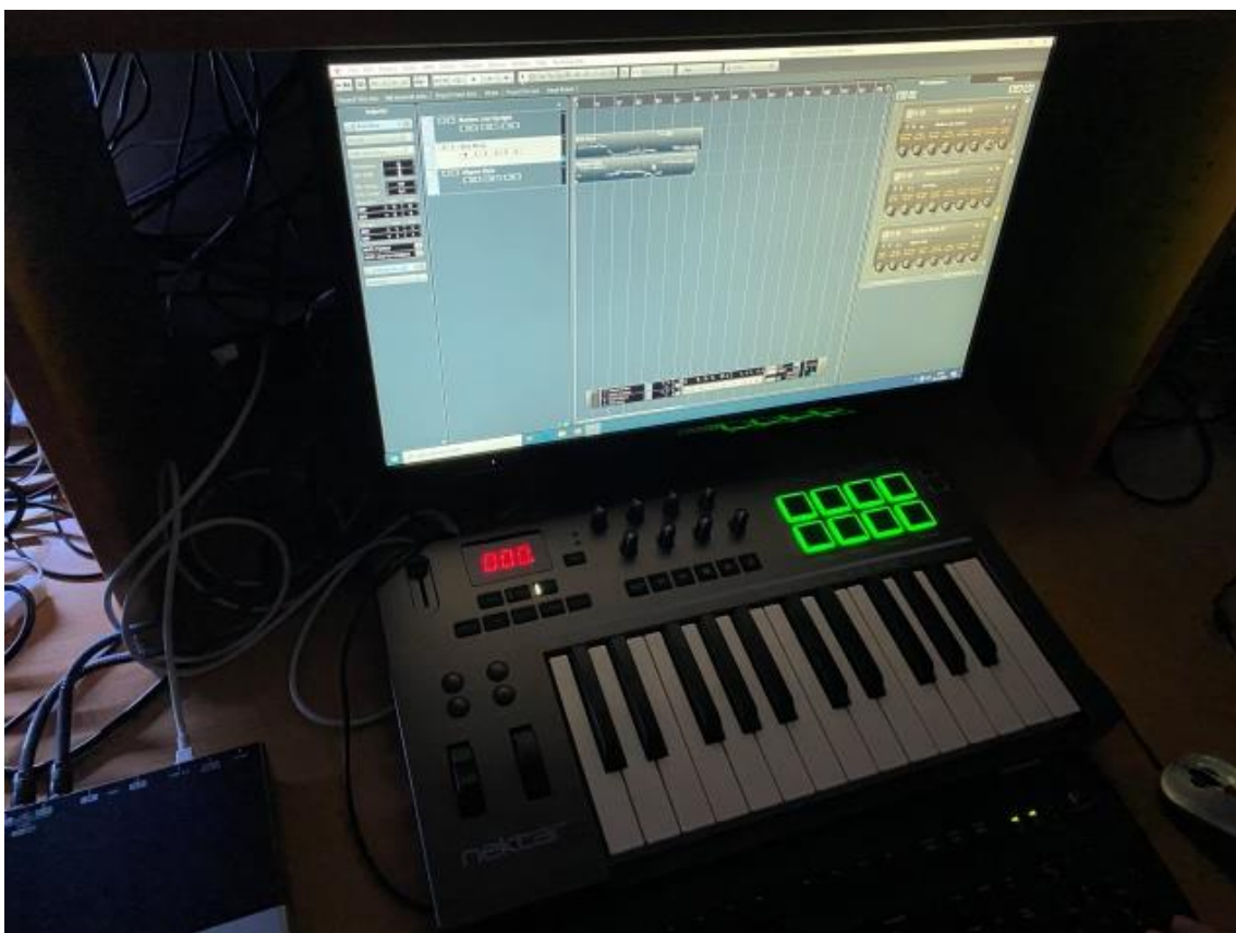
Musikklab i kulturskolen

Etter en innføring i mulighetene vi har, velger eleven på vårparten et prosjekt de vil jobbe ekstra med (semesteroppgave). Dette kan for eksempel være: Musikk til en film, en remiks eller en egen komposisjon m.m.