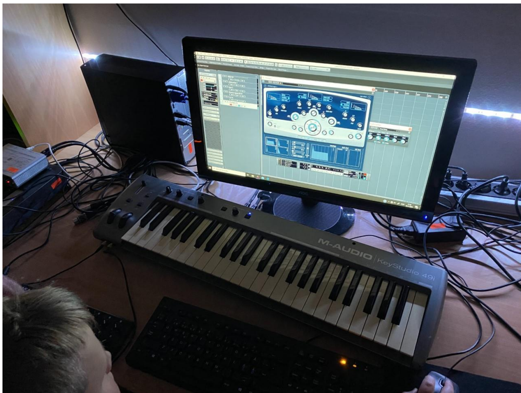
Undervisning i musikklab