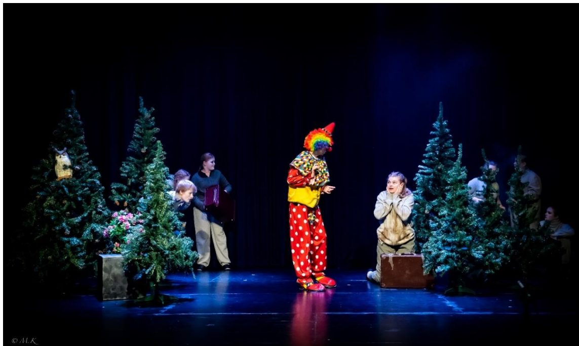
Den store fargeslukeren, forestilling ved Karmøy Kulturskoles ungdomsteater, 2022