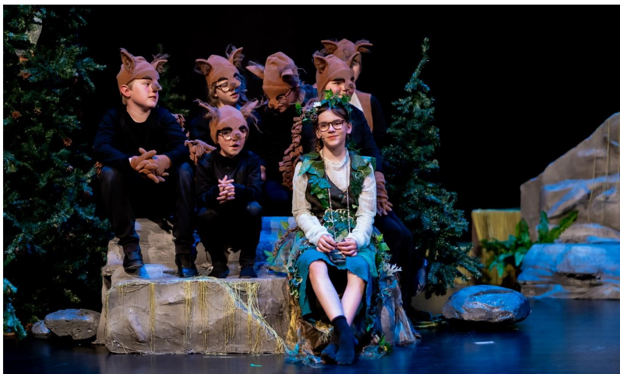
Fra teaterforestillingen «Tambar», Karmøy Kulturskoles barneteater, 2022

Prosesen fram mot forestilling er en viktig del av læringen i teaterfaget. Undervisningen bidrar til å fremme gode muntlige og sosiale ferdigheter på teaterscenen, som også kan være verdifulle for elevene i andre sammenhenger. Vi legger til rette for at hver enkelt elev kan få anerkjenne sin egenart, og samtidig videreutvikle sin egen identitet.