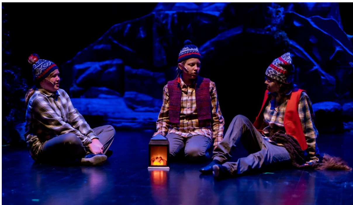
Fra teaterforestillingerne «Tambar», Karmøy Kulturskoles barneteater, 2022