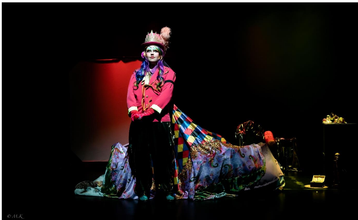
Den store fargeslukeren, forestilling ved Karmøy Kulturskoles ungdomsteater, 2022