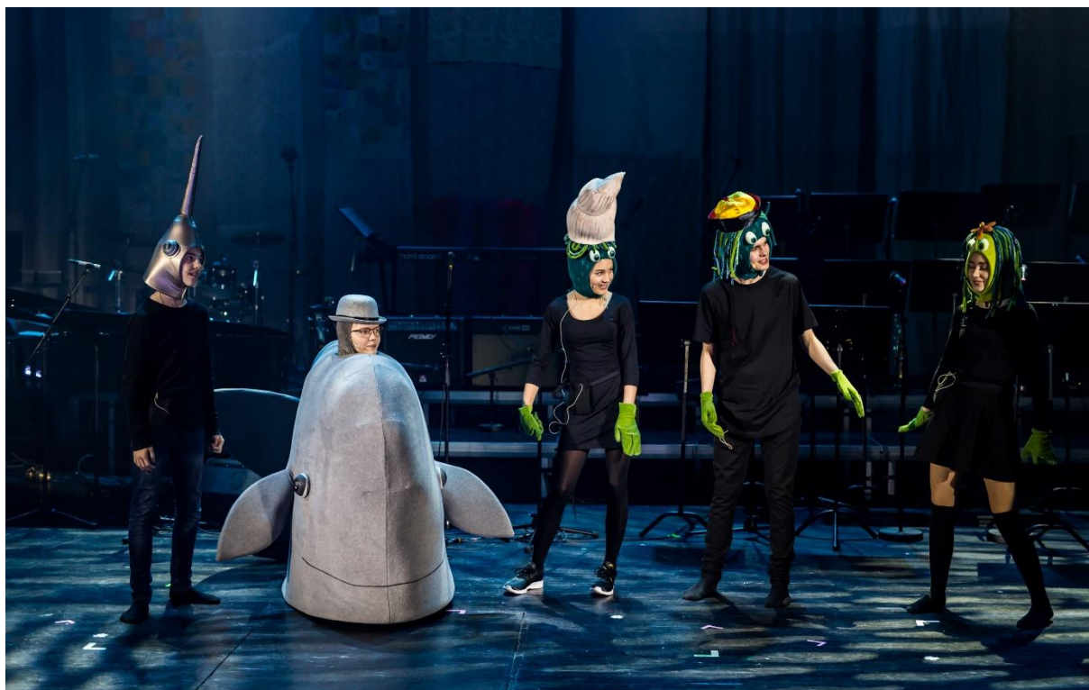
Fra jubileumsforestillingen «Lykken er» i Karmøy Kulturskole, 2018