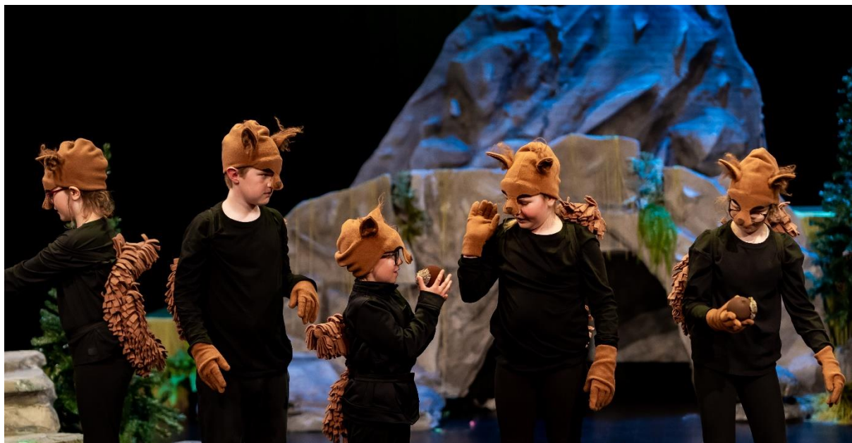
Fra teaterforestillingen «Tambar», Karmøy Kulturskoles barneteater, 2022